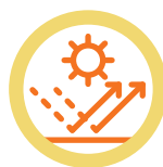
FILTRE UVA și UVB